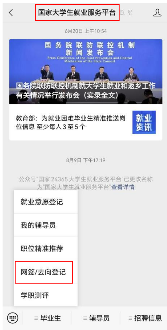
图 13 国家大学生就业服务平台