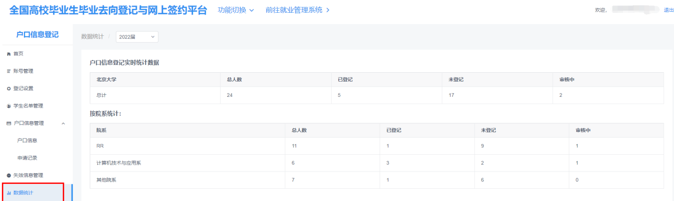
图 12 数据统计

学校（院系）用户可在“数据统计”中，查看毕业生档案/户口信息登记的实时统计数据。