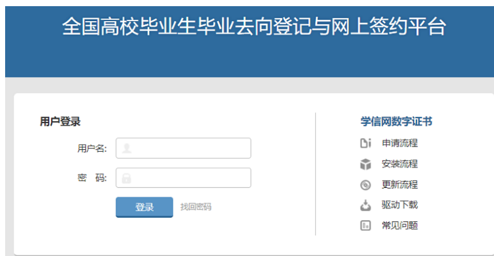
图 2 用户登录