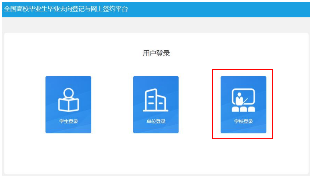
图 1 选择登录用户

学校（院系）用户进入登记平台（ wq.ncss.cn ），选择“学校登录”，使用全国高校毕业生就业管理系统（以下简称“就业管理系统”）账号登录，如无账号请先联系上级用户进行创建。