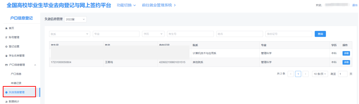
图 11 失效信息管理