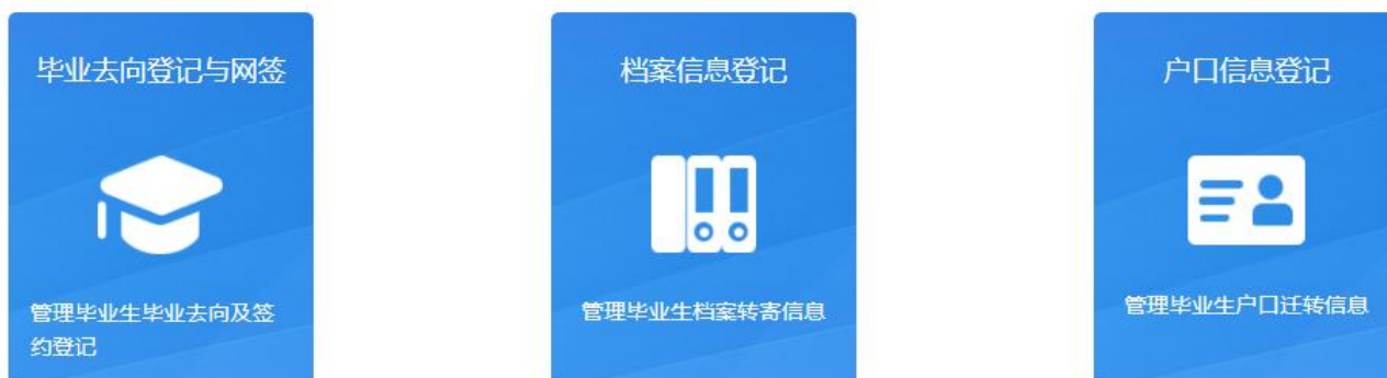
图 3 选择功能模块

欢迎您使用全国高校毕业生毕业去向登记与网上签约平台，请从下列功能模块中选择应用相关功能。