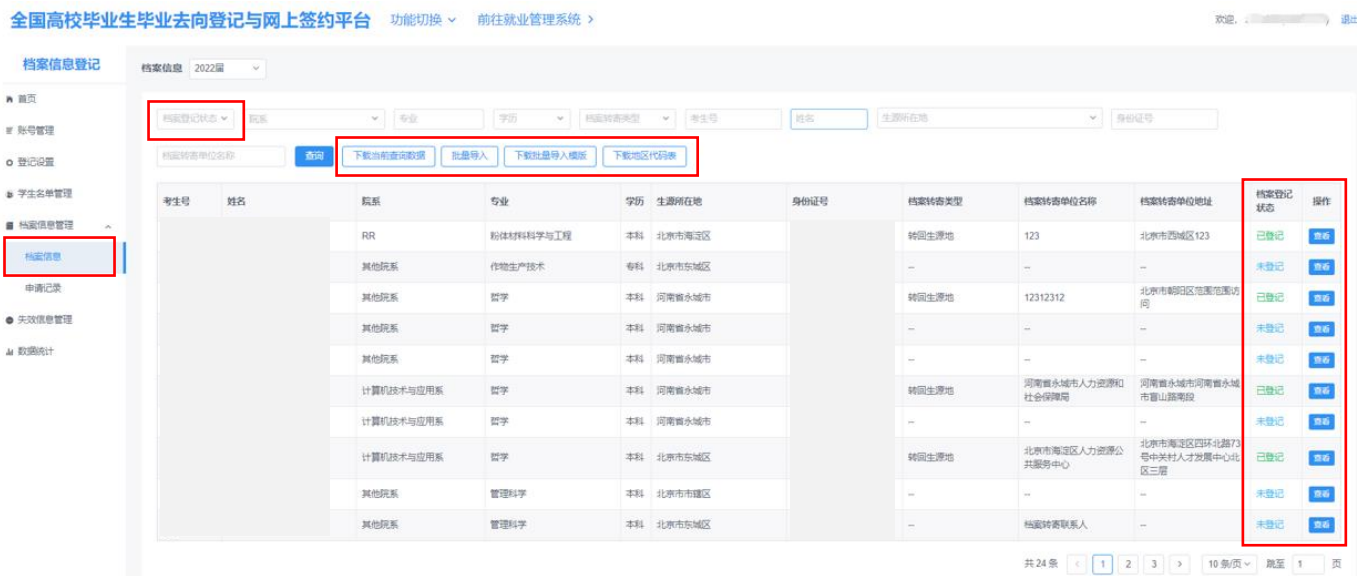
图 8 档案/户口信息

“档案/户口信息”显示了“学生名单管理”中所有毕业生的数据。登记状态为“已登记”表示毕业生已完成了档案/户口信息登记，并同步到了就业管理系统；登记状态为“未登记”表示毕业生尚未申请登记档案/户口信息；登记状态为“审核中”表示毕业生已提交了档案/户口信息登记申请，学校（院系）用户尚未审核。