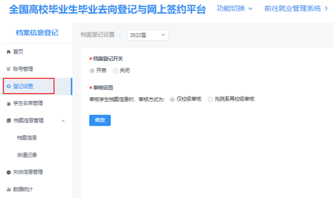
图 6 登记设置

（2）开启档案信息登记、户口信息登记时，需分别设置审核方式，分为仅校级审核、先院系再校级审核。若选择先院系再校级审核，需保证毕业生所在院系都有对应的院系账号（院系名称完全一致），且每个院系至少有一个有读写权限的账号。 注意： 如需修改审核方式，应确保没有任何处于流程中的数据。