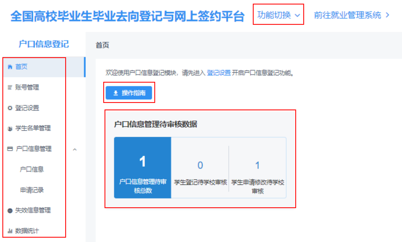
图 4 功能模块界面

注意： 1.若省级用户尚未开启功能模块，则学校（院系）用户不可进入该模块进行操作；2.仅学校用户菜单栏有账号管理和登记设置。